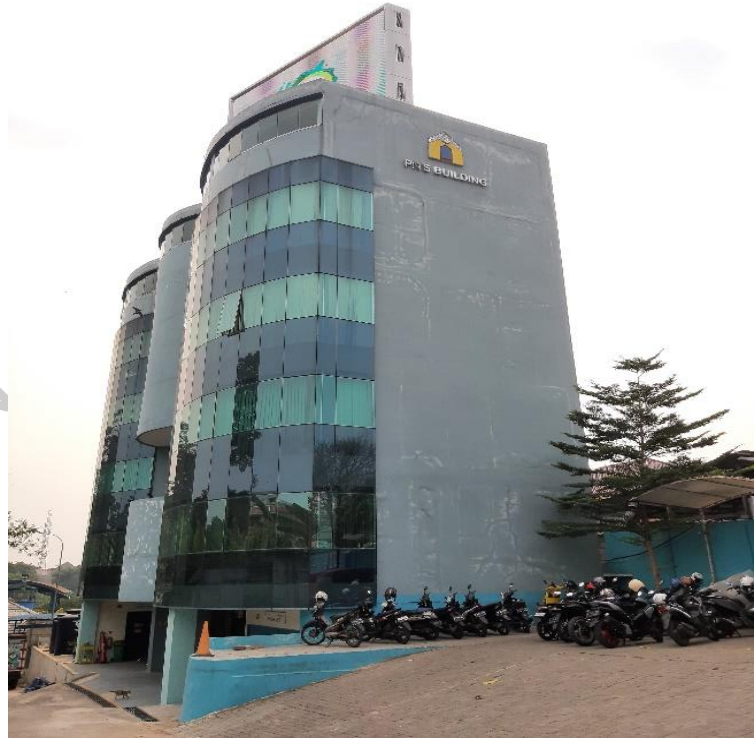
Gambar 1. 1 Gedung