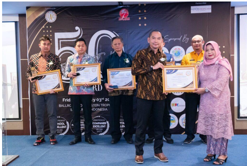
Gambar 2.2 Penghargaan Indonesian Companies Excellent Award 2023