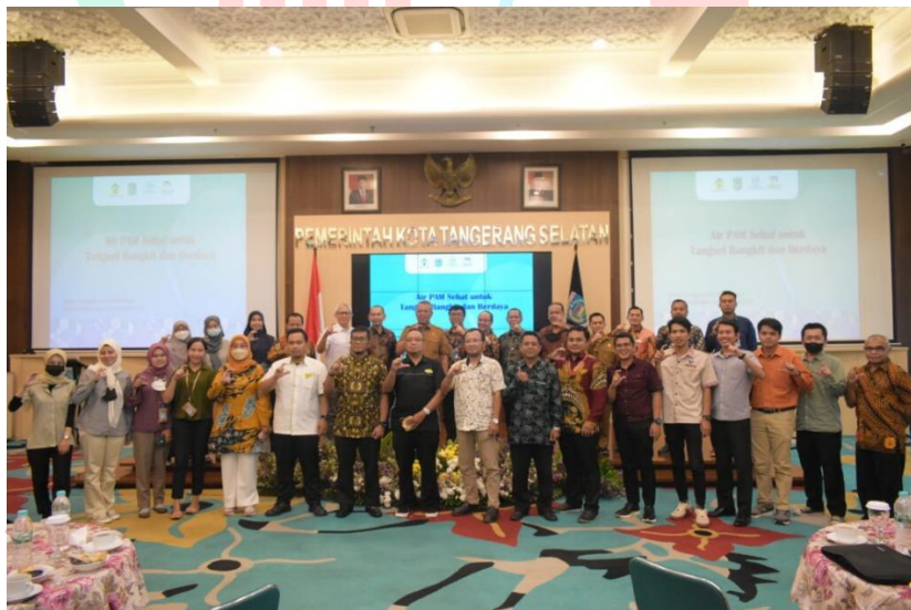
Gambar 2.5 Customer Gathering UMB