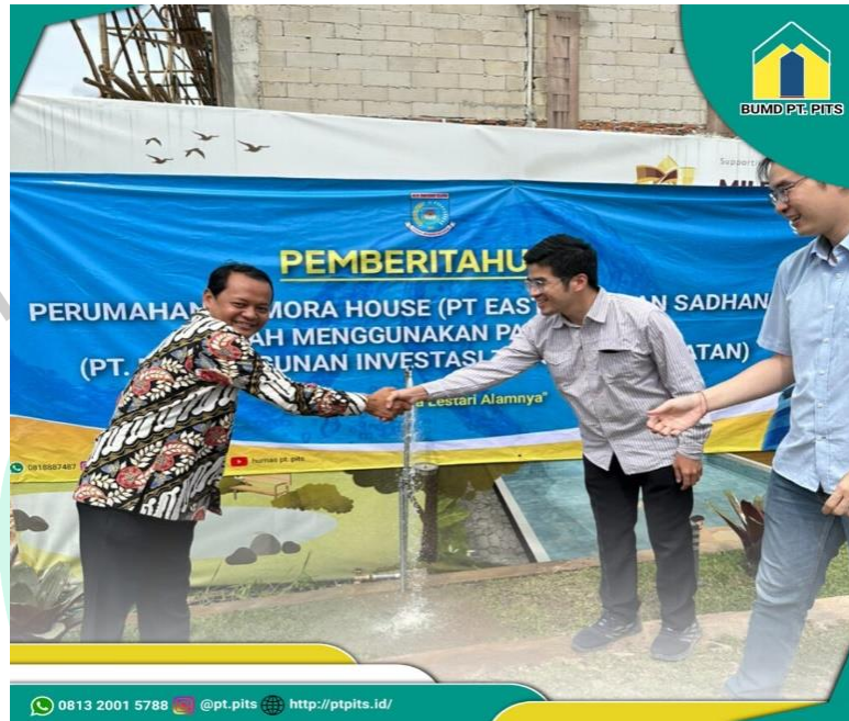
Gambar 2.3 Peresmian Aliran Air PAM Pertama Perumahan Memora House