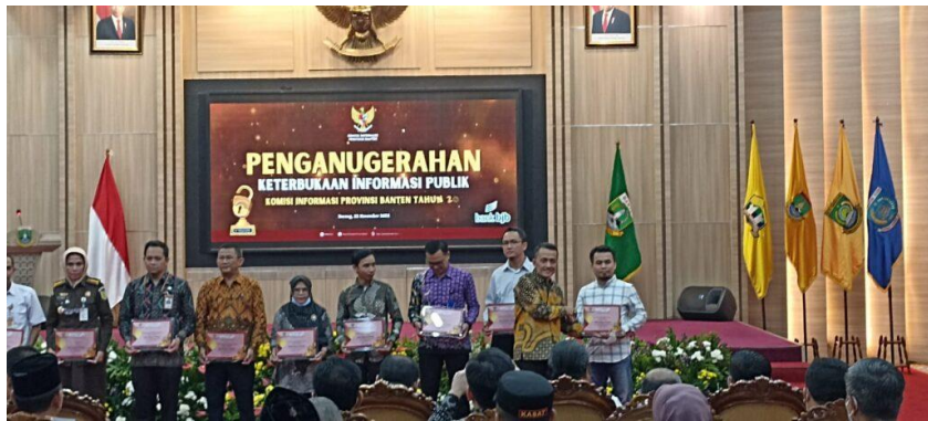
Gambar 2.4 Penghargaan Keterbukaan Informasi Publik 2022