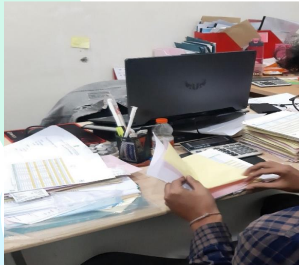
Gambar 3.3 Proses Pengarsipan Data Pemasukan Harian Locket