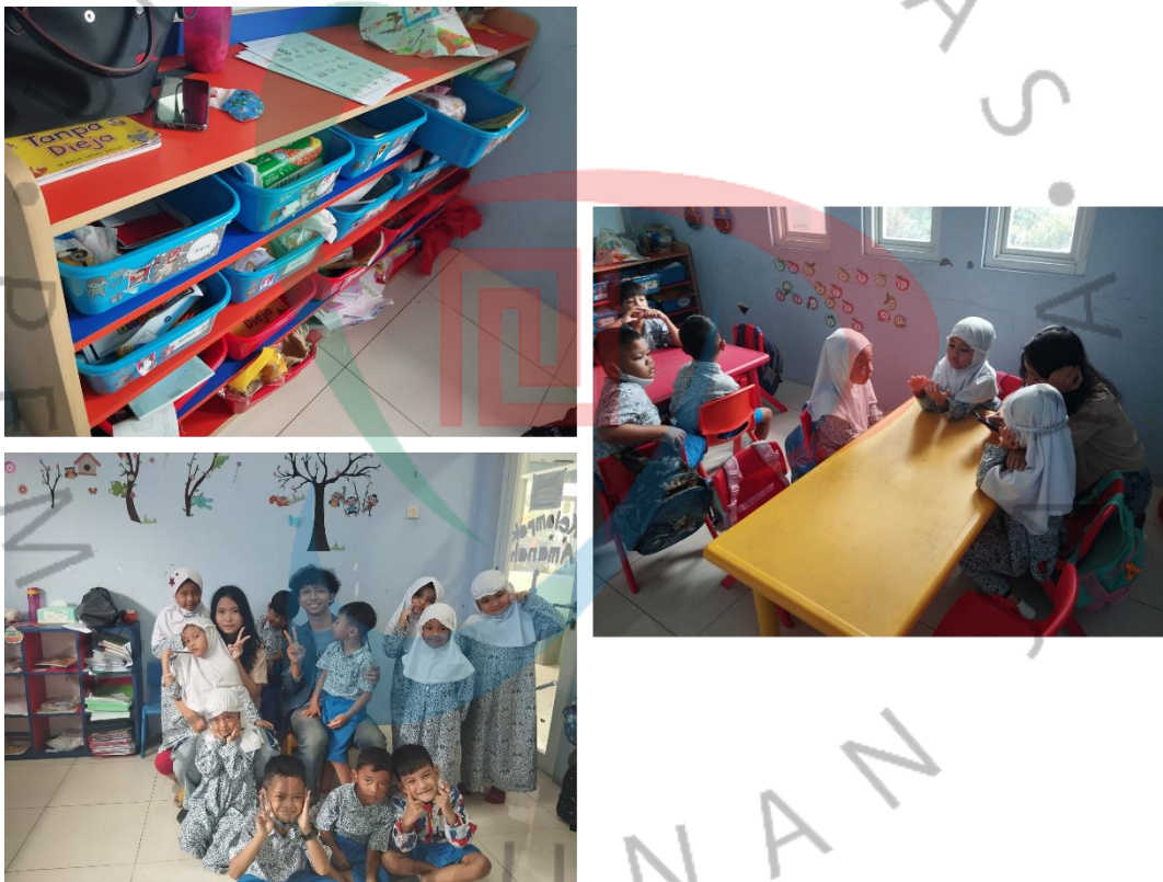
Lampiran 6. Dokumentasi di TK Raih Impian