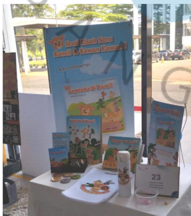
Lampiran 8. Booth dan Media Pendukung