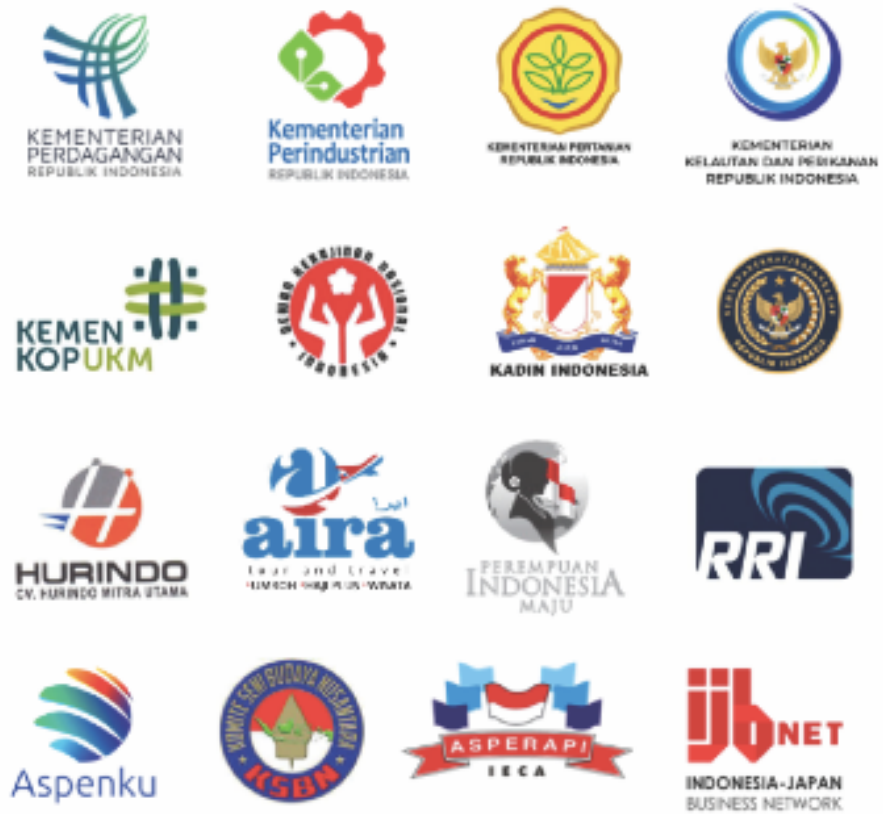
Gambar 2.3 Mitra dan Klien PT. Aira Mitra Media