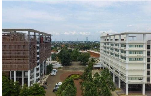
Gambar 2.1 Bangunan Universitas Pembangunan Jaya

Universitas Pembangunan Jaya (UPJ) merupakan perguruan tinggi swasta yang berlokasi di Bintaro dan didirikan pada tahun 2011. UPJ didukung oleh Kelompok Usaha Pembangunan Jaya yang menjalankan berbagai unit usaha di berbagai bidang seperti properti, manufaktur, konsultasi manajemen, konsultasi desain, konstruksi, pariwisata, perdagangan, teknik mesin dan