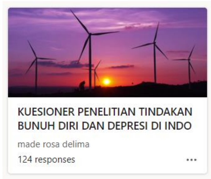
Lampiran 4. kuesioner penelitian tindakan bunuh diri dan depresi

Kuesioner Online – Perancangan desain visual kampanye pencegahan depresi dan Tindakan bunuh diri di kota tangsel: