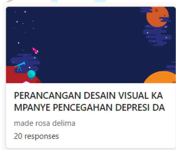
Lampiran 5. Kuesioner kebutuhan desain visual

Kuesioner Online – Perancangan desain visual kampanye pencegahan depresi dan Tindakan bunuh diri di kota tangsel: