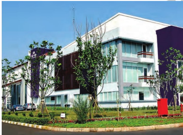
Gambar 2.1 Gedung Kantor Pusat PT. Propan Raya ICC

PT. Propan Raya ICC adalah perusahaan cat 100% asli Indonesia yang bertujuan untuk menjadi yang paling inovatif dalam memproduksi cat dan bahan bangunan. Untuk memenuhi kebutuhan pasar, perusahaan terus mengembangkan cat-cat yang inovatif dan berkualitas dunia.