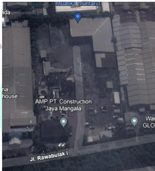
Gambar 1. 1 PT. Jaya Konstruksi Manggala Pratama Unit 1 Asphalt Mixing Plant

Pelaksanaan Kerja Profesi dilaksanakan di laboratorium PT. Jaya Konstruksi Manggala Pratama Unit 1 Asphalt Mixing Plant yang terletak di Jl. Rawa Bulak 1 Kav. 10, Kawasan Industri Pulo Gadung, Jakarta Timur, DK Jakarta dan Proyek hotmix berada di Jalan Rasuna Said, Jakarta Selatan.